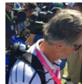
Het bewuste balletje